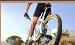
LA VITA È MOVIMENTO

Mensile n.101 - Aprile 2024 - 0,50€ - Distribuzione gratuita