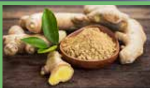
PER IL SISTEMA ARTICOLARE