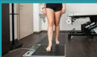
TEST STABILO BOARD