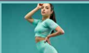
LA PROVA COSTUME INIZIA ORA